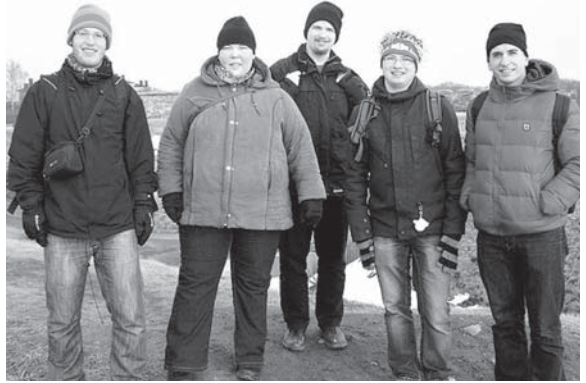
La partoprenantoj en Suomenlinna