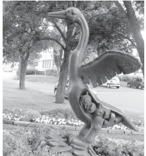
Kenkälintu, taideteos Oriveden keskustassa

KURSSI ALKAA maanantaina 14.7. klo 11.30 lounaalla, jonka jälkeen klo 13 on koko opiston yhteinen kurssin avaus. Tämä kesätapaamisemme päättyy perjantaina 18.7. iltapäiväkahviin n. klo 13.30. Teemme retken Purnun taidekeskukseen, jossa on 17 taiteilijan teoksia Suomesta, Ruotsista ja Venäjältä. Näyttelyn aihe on Mistä tulet? Where are you from? Varifrån kommer du? Tämä teemahan sopii meille esperantisteillekin. Retkestä maksetaan erikseen.