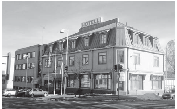
Hotelo Seurahuone.